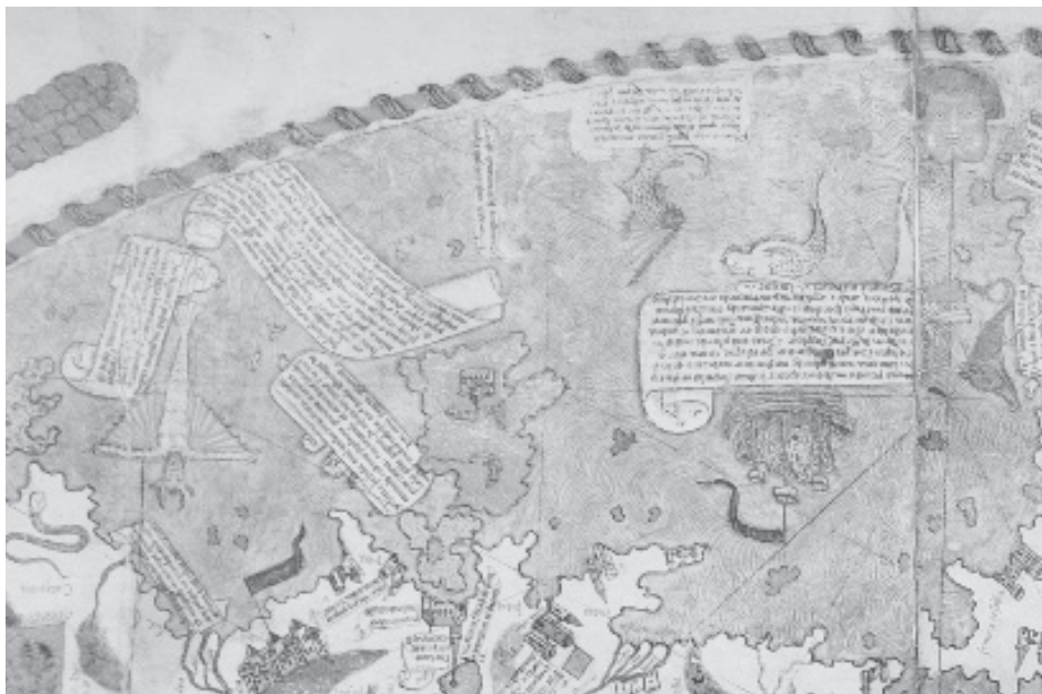
Mappa Mundi 1457, detail.

In this poster, we will present a world map of representations of imaginary creatures related to water (mermaids, kappa, dragons, etc.) from the collection of the National Museum of Ethnology. By mapping the variety of water monsters (with certain exaggerated body parts, unnatural combination of elements from various animals etc.) from around the world, we may detect a certain pattern in the geographical distribution of types of monsters which may be due to cultural transmission, or some kind of correlation between human imagination and the environment.